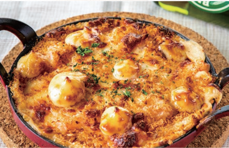
プリプリ海老と帆立のマカロニグラタン Macaroni Gratin Shrimp and Scallops