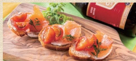
スモークサーモンとトマトのブルスケッタ Smoked Salmon and tomato bruschetta