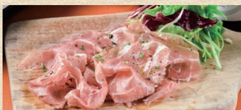
イタリア仕込みの生ハム Italian-made Ham