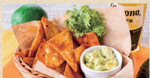
アボカドディップとトルティーヤチップス Avocado Dip and Tortilla Chips 530 円