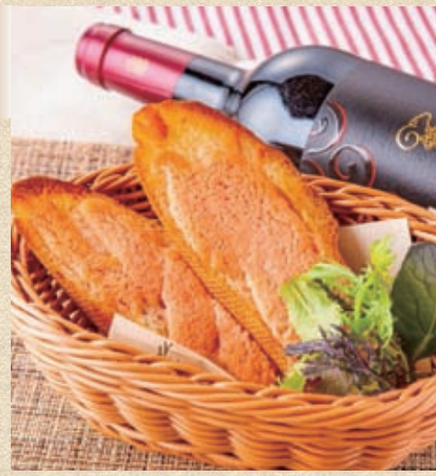
明太フランス (2枚) Mentaiko Toast (2 piece)