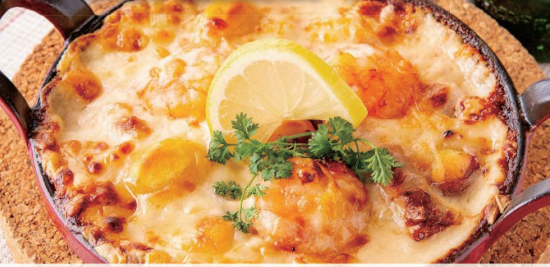
ミラーージュドリア MIRAGE Doria