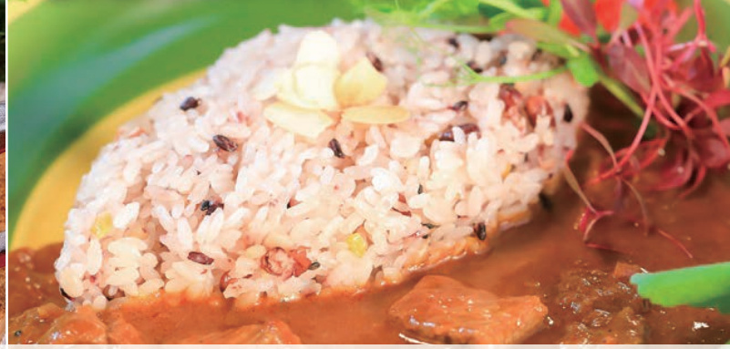
シェフズスペシャル ビーフカレー Chef's Special Beef Curry