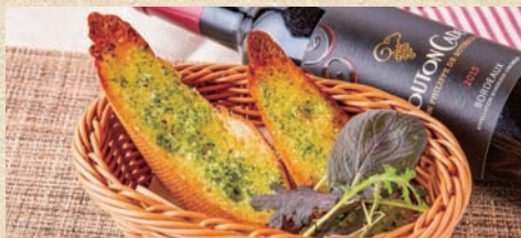
ガーリックトースト (2枚) Garlic Toast (2 piece)