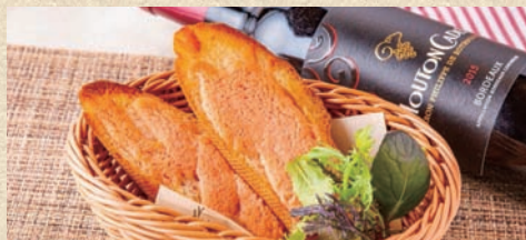
明太フランス (2枚) Mentaiko Toast (2 piece)