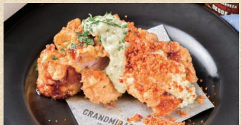
チキンフリット タルタル添え Served with chicken frit tartar sauce 680 円