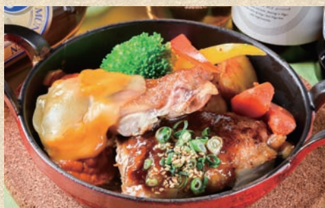
イタリアンチキンステーキ トマト&チーズ Italian Chicken Steak Tomato & Cheese