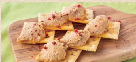
自家製ポークリエット&クラッカー Homemade pork rillettes and crackers