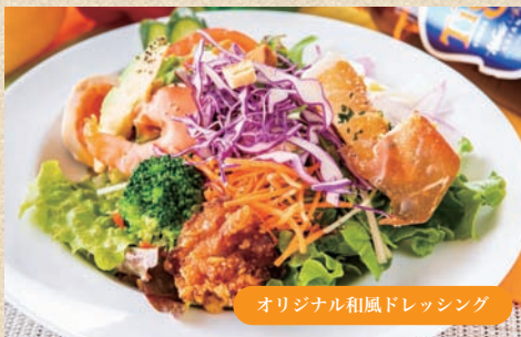
よくばりミラーージュサラダ Special Mirage Salad