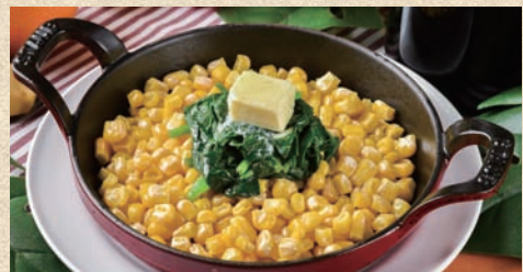
コーンポパイバター Sautéed spinach and corn butter 420 円