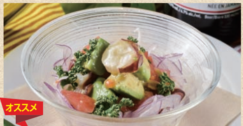
アボカドタコわさび Avocado & Octopus Wasabi 530 円