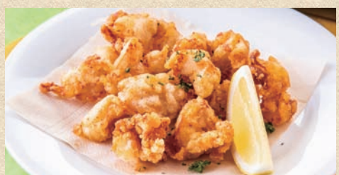
鶏ナンコツの唐揚げ Deep-fried chicken cartilage. 530 円