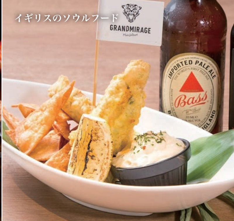
フィッシュ&チップス Fish and Chips