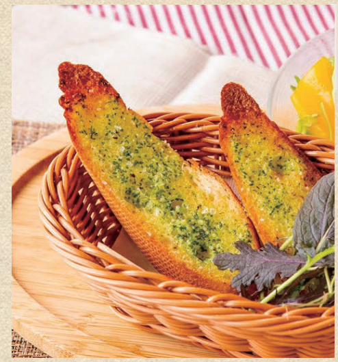
ガーリックトースト (2枚) Garlic Toast (2 piece)