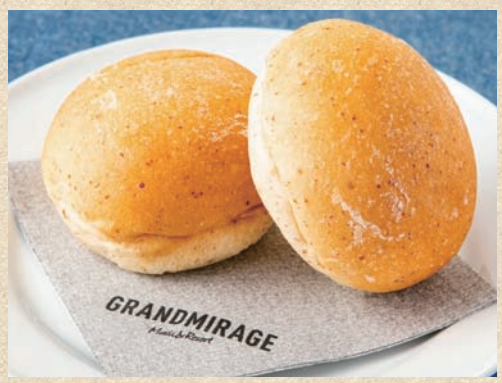
麦芽パン (2ヶ) Bread (2 piece)