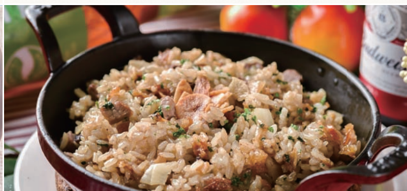
ガーリックライス Garlic Rice