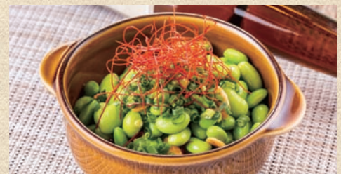
枝豆のペペロンチーノ Peperoncino of Edamame 580 円