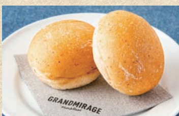
麦芽パン (2ケ) Bread (2 piece)