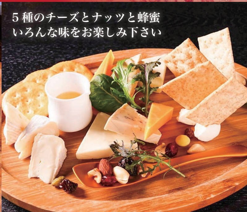
5 種のチーズとナッツと蜂蜜 いろいろな味をお楽しみ下さい