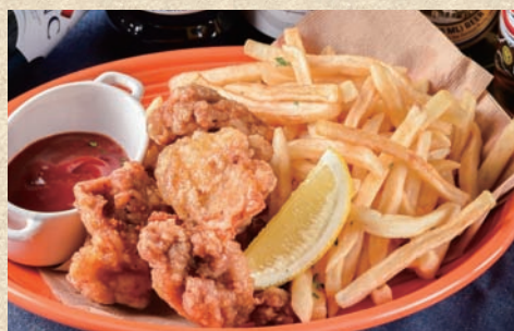
フライドチキン&ポテト Fried Chicken and Potatoes