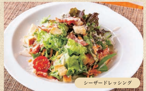
たっぷりクルトンのシーザーサラダ Caesar Salad with Plenty of Croutons