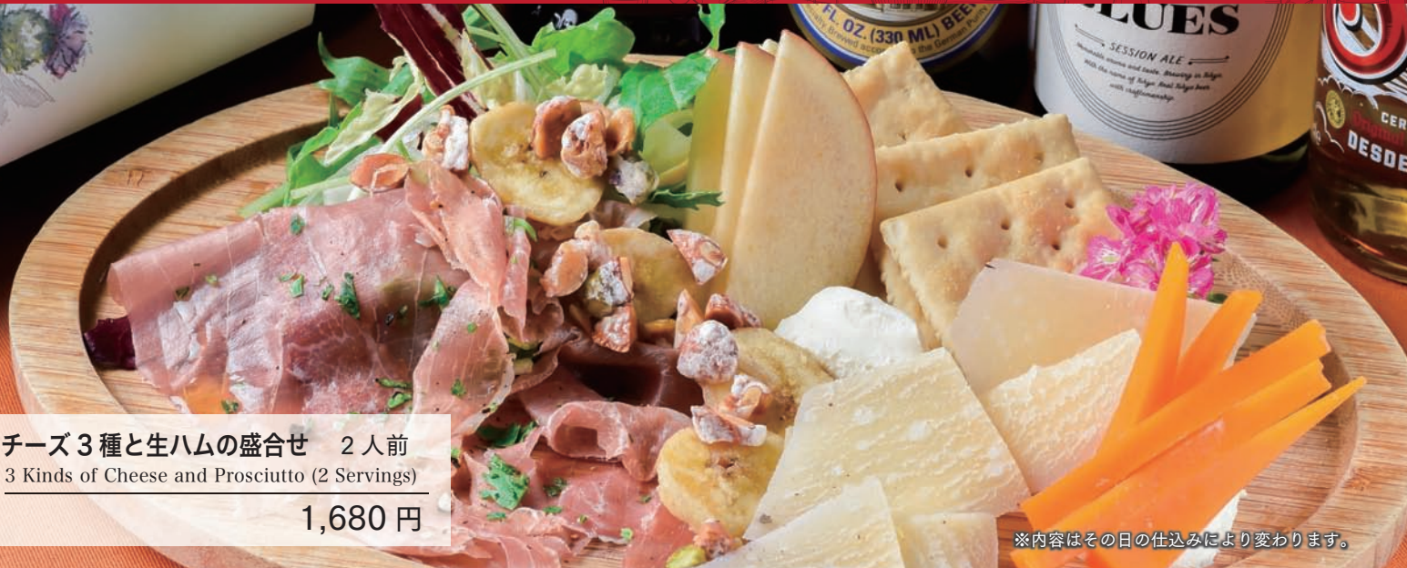
チーズ3種と生ハムの盛合せ 2人前 3 Kinds of Cheese and Prosciutto (2 Servings) 1,680 円