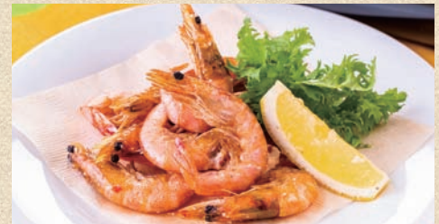
芝海老のフリット Shrimp Frit 480 円