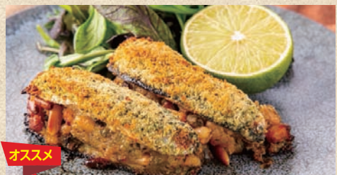
イワシの香草パン粉焼き レモン添え Sardine Slicing Breadcrumbs with Lemon 580 円