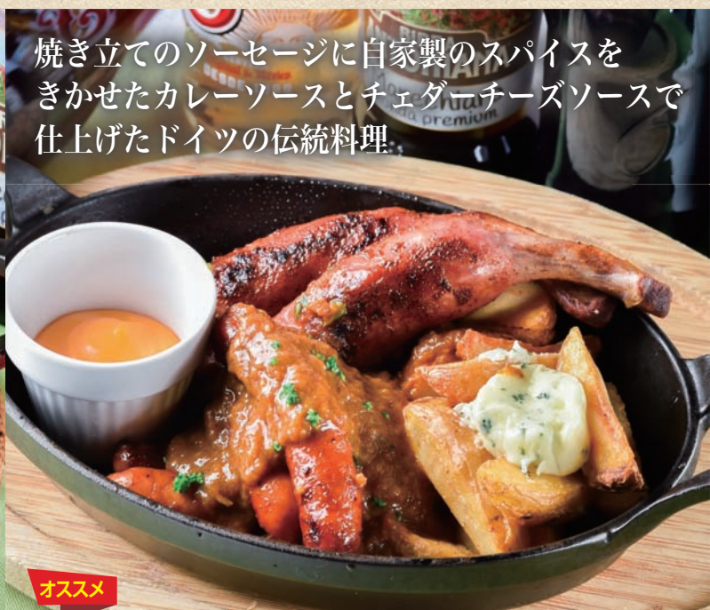
焼き立てのソーセージに自家製のスパイスを きかせたカレーソースとチェダーチーズソースで 仕上げたドイツの伝統料理