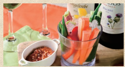
野菜スティック ピリ辛もろみマヨネーズ Vegetable Stick 530 円