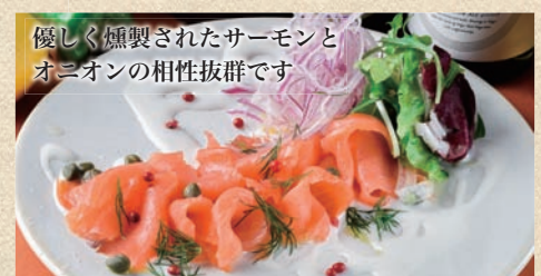
優しく燻製されたサーモンと オニオンの相性抜群です スモークサーモンのカルパッチョ Smoked Salmon Carpaccio 980 円