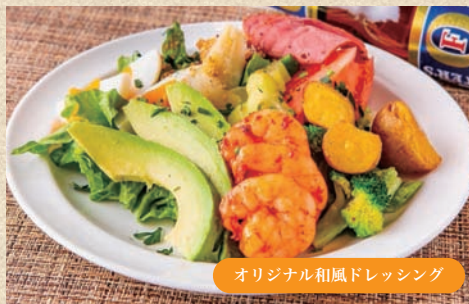
アボカド&シュリンプサラダ Avocado & Shrimp Salad