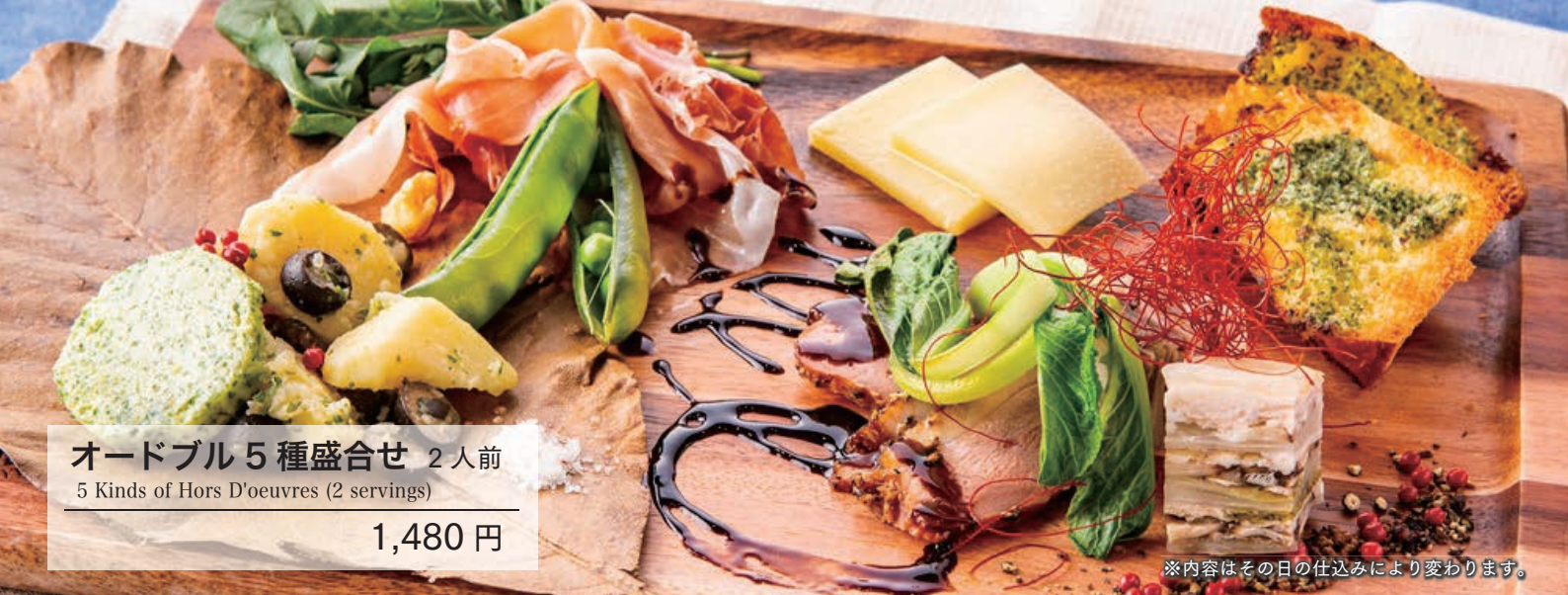
オードブル 5 種盛合せ 2 人前 5 Kinds of Hors D'oeuvres (2 servings) 1,480 円