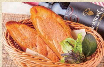
明太フランス (2枚) Mentaiko Toast (2 piece)