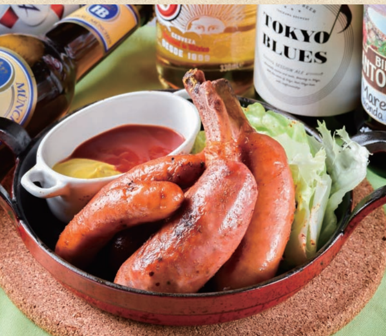
ソーセージグリル Sausage Grill