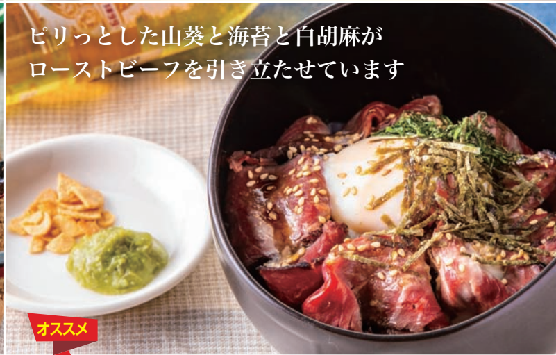
ローストビーフ丼 わさび添え Roast Beef Bowl with Wasabi