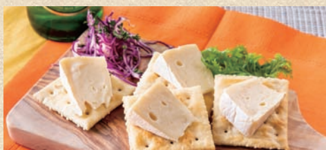
カマンベールチーズ&クラッカー Camembert Cheese & Crackers