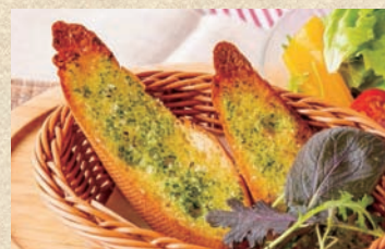
ガーリックトースト (2枚) Garlic Toast (2 piece)