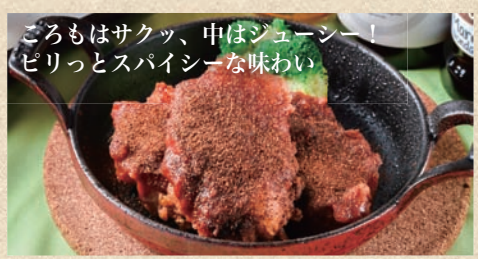
ごろもはサクッ、中はジューシー！ ピリッとスパイシーな味わい ミラージュチキン (赤) Mirage Chicken Red Pepper 2ピース 450 円 お得な3ピース 630 円