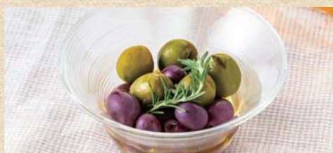
オリーブマリネ Olive Marinade