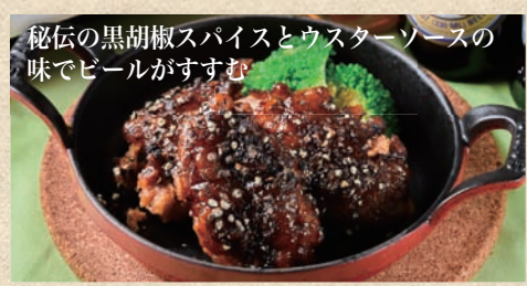
秘伝の黒胡椒スパイスとウスターソースの 味でビールがすすむ ミラージュチキン (黒) Mirage Chicken Black Pepper 2ピース 450 円 お得な3ピース 630 円