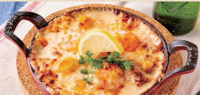
ミラージュドリア MIRAGE Doria