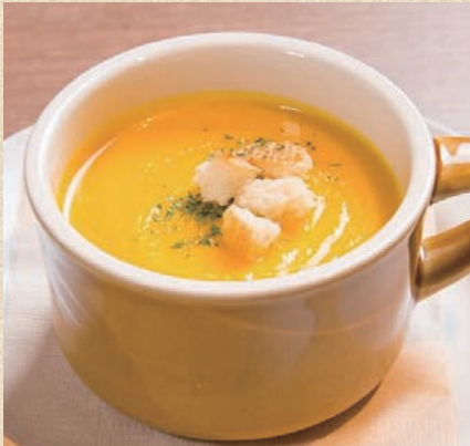
コーンスープ Corn Soup