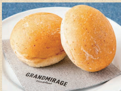
麦芽パン (2ヶ) Bread (2 piece)