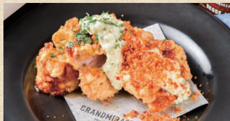
チキンフリット タルタル添え Served with chicken frit tartar sauce 680 円