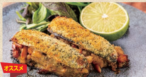
イワシの香草パン粉焼き レモン添え Sardine Slicing Breadcrumbs with Lemon 580 円