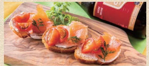
スモークサーモンとトマトのブルスケッタ Smoked Salmon and tomato bruschetta