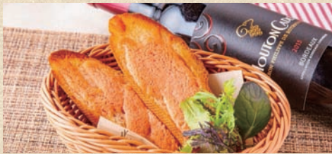
明太フランス (2枚) Mentaiko Toast (2 piece)