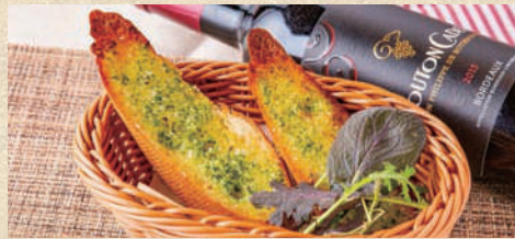
ガーリックトースト (2枚) Garlic Toast (2 piece)