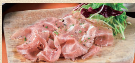
イタリア仕込みの生ハム Italian-made Ham