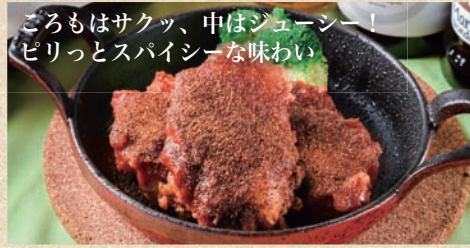
ごろもはサクッ、中はジューシー！ ピリッとスパイシーな味わい ミラージュチキン (赤) Mirage Chicken Red Pepper 2ピース 480 円 お得な3ピース 680 円