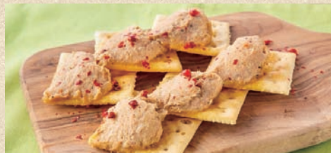
自家製ポークリエット&クラッカー Homemade pork rillettes and crackers