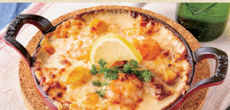
ミラージュドリア MIRAGE Doria