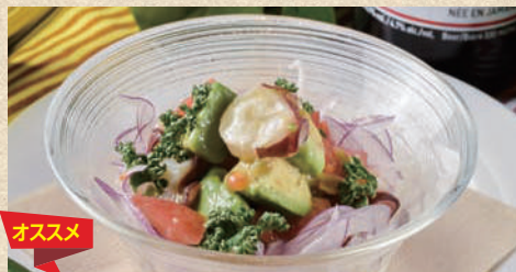
アボカドタコわさび Avocado & Octopus Wasabi 580 円