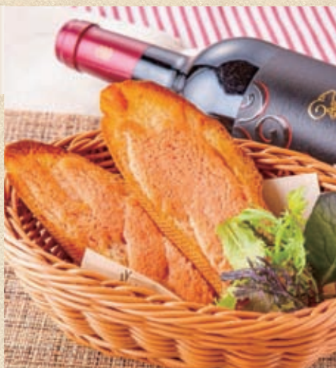
明太フランス (2枚) Mentaiko Toast (2 piece)