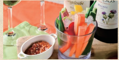
野菜スティック ピリ辛もろみマヨネーズ Vegetable Stick 530 円