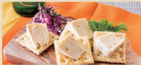
カマンベールチーズ&クラッカー Camembert Cheese & Crackers