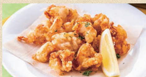
鶏ナンコツの唐揚げ Deep-fried chicken cartilage. 530 円