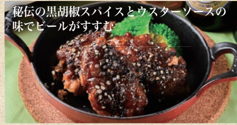
秘伝の黒胡椒スパイスとウスターソースの 味でビールがすすむ ミラージュチキン (黒) Mirage Chicken Black Pepper 2ピース 480 円 お得な3ピース 680 円