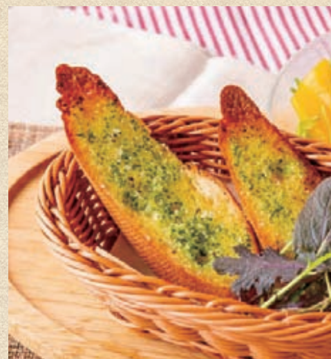
ガーリックトースト (2枚) Garlic Toast (2 piece)