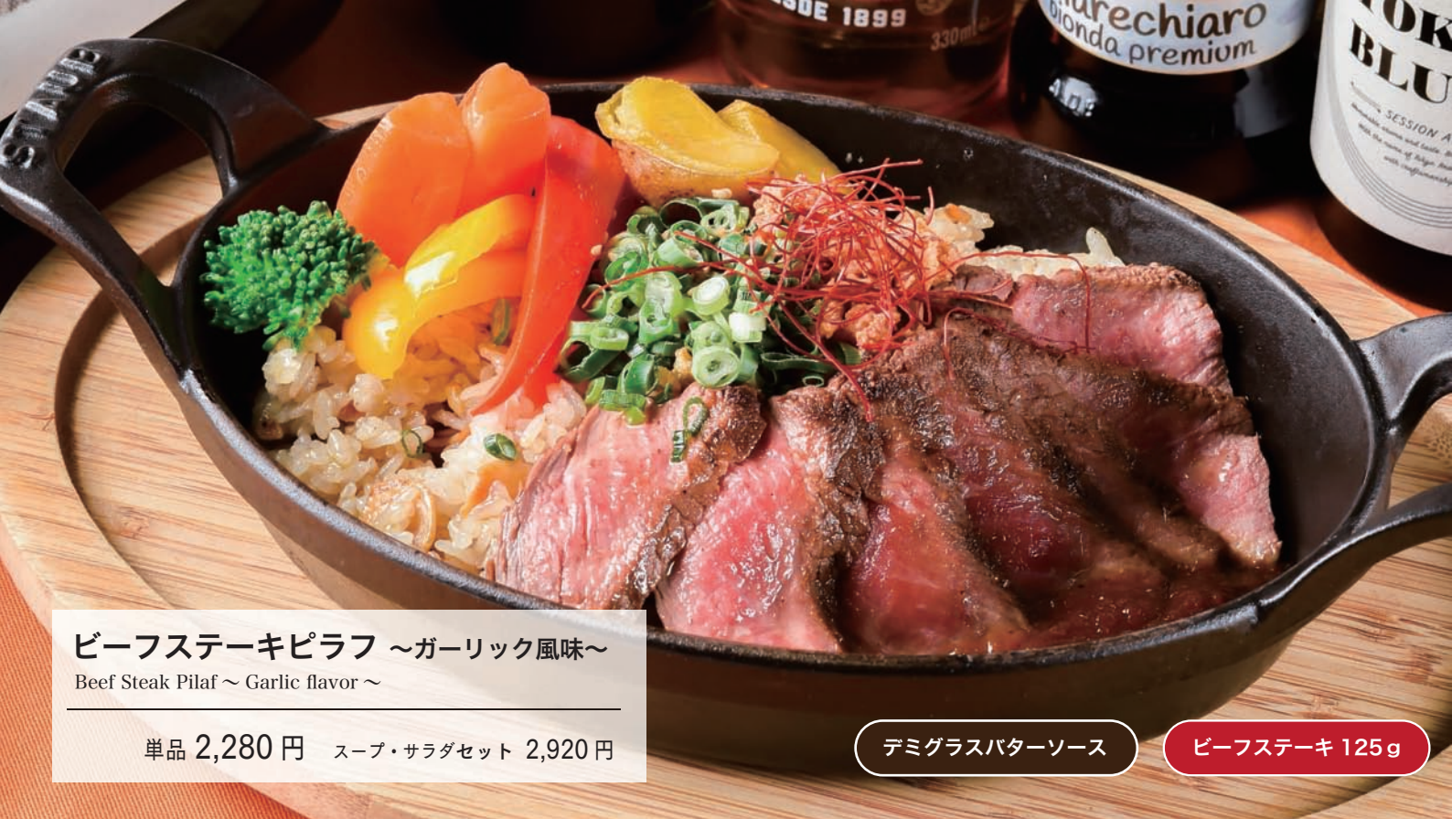
ビーフステーキピラフ ~ガーリック風味~ Beef Steak Pilaf ~ Garlic flavor ~